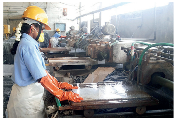
负责任石材项目在改善供应链的工作上已取得一定成效