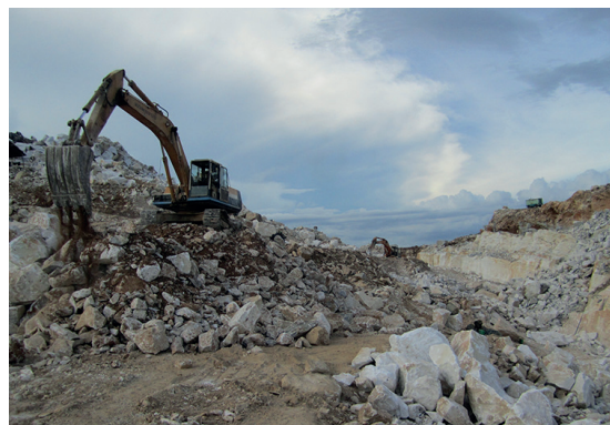
负责任石材项目在中国、印度及越南进行，并向巴西扩展。