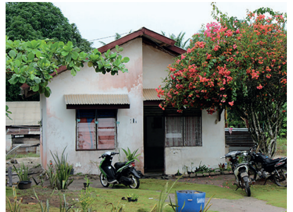
Akomodasi yang aman dan higienis penting bagi kesejahteraan dan produktifitas pekerja di perusahaan