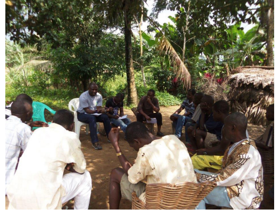
工人委员会也许不正式，但是他们的会议及决定都应被记录在案。