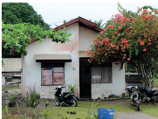
安全与卫生的宿舍对现场工人的身心健康与生产力而言是十分重要的。