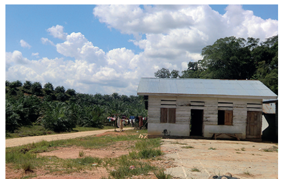
宿舍应该可以从内进行反锁。